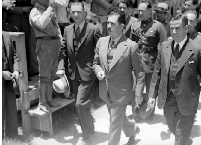
Rodolfo Elías Calles, extrema izquierda, acompaña al presidente Cárdenas en un evento.

Bajo la dirección de Rodolfo Elías Calles, se aprobaron los contratos para la construcción de 15 campos de aterrizaje. El Puerto Aéreo Central de México tuvo un amplio hangar (1935) para 15 aviones, mientras se proyectaba un inmueble destinado a estación de embarque. En el ámbito del turismo, se anunciaba la expedición de 140 vuelos de clase turista.