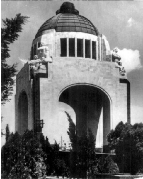
Monumento a la Revolución donde reposan los restos del General Lázaro Cárdenas. Reproducción autorizada por el INAH.

las aguas del río Cuautitlán que irrigarían las tierras de la población del mismo nombre. En provincia se realizaron importantes obras en varias ciudades para evitar las inundaciones: Nogales, San Cristóbal de las Casas, Acámbaro, Matamoros, etc.