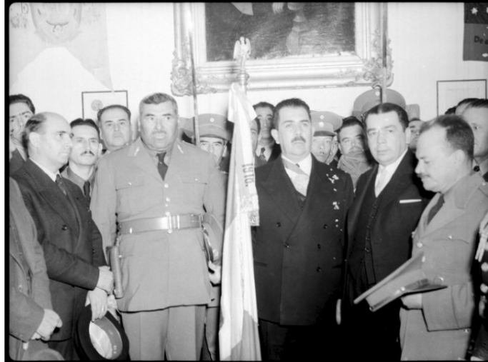
Francisco Múgica, extrema derecha, asiste a una ceremonia presidida por el General Lázaro Cárdenas.

Aunque no fue un asunto que involucrara directamente a la Secretaría de Comunicaciones y Obras Públicas, la expropiación del petróleo hecha por el presidente Cárdenas el 18 de marzo de 1938 –que lo hizo pasar a la historia- está relacionada estrechamente con el secretario General Francisco Múgica, quien no solo respondió al llamado del presidente que hizo a todos los mexicanos para colaborar al pago que representaba dicha expropiación, aportando ocho mil pesos que tenía ahorrados sino que fue más allá al redactar –a petición del mismo Cárdenas- la exposición de motivos para realizar tal acto. Así lo relata doña Amalia Solórzano viuda de Cárdenas a través de una entrevista televisada: “...mi marido y Múgica eran muy cercanos, ellos pasaban los fines de semana en Cuernavaca y constantemente se reunía con él, pues Múgica también tenía una propiedad en aquella ciudad; un día, en plena crisis petrolera, regresaban a la Ciudad de México, cuando el General Cárdenas les pidió detenerse en un paraje y le pidió a Múgica que lo acompañara, ya habían estado analizando largamente el problema con las compañías petroleras extranjeras, y ahí en ese lugar le pidió que le preparara un borrador de la exposición de motivos para declarar la expropiación petrolera.” 4